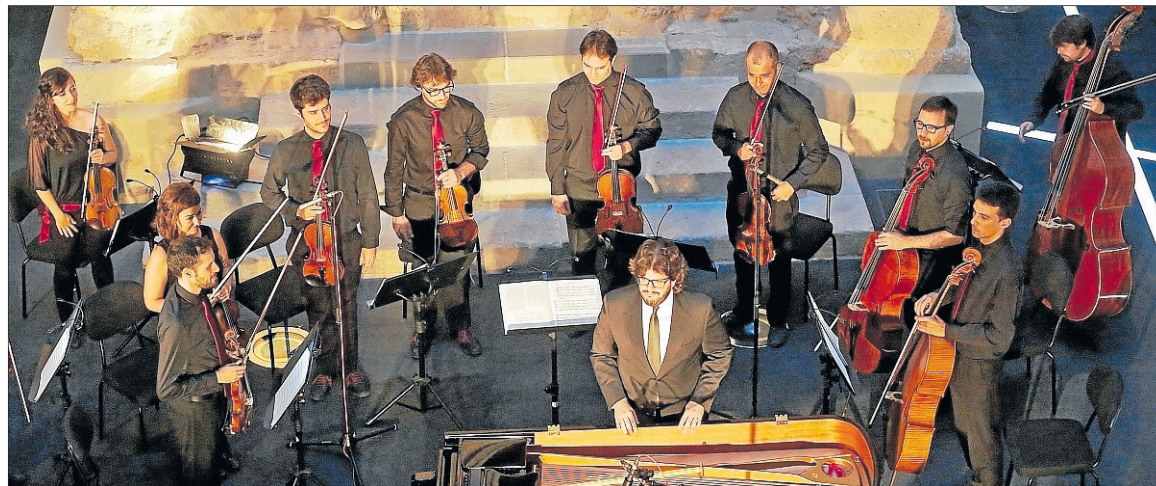
Las piezas de Mozart y Grieg fueron las encargadas de abrir la velada en el Centre El Seminari.

Frente a la capilla románica de Sant Pau, los asistentes no acababan de llenar, como en recitales anteriores del mismo festival, pero pronto el espacio iba a desbordar música. Las obras orquestales de Mozart y Grieg fueron las encargadas de abrir la velada. La segunda parte tuvo como solista a Parra, con el Concierto para piano y Orquesta n.º 13 de Mozart. Fue atentamente arropada por la or-