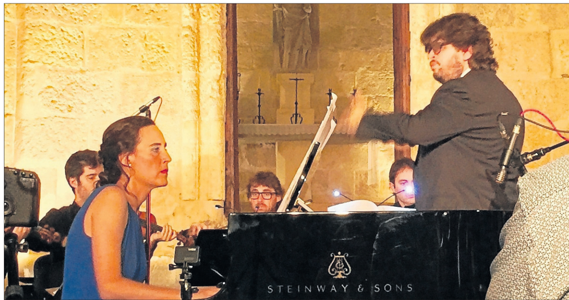
Vermut Miró y el catering Ipsum Tarraco se encargaron de poner el maridaje tras el concierto.

questa, que le brindó momentos de bello fraseo e intenso lirismo. Como colofón final, pudimos disfru-